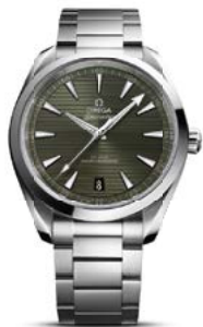
SEAMASTER AQUA TERRA Co-Axial Master Chronometer

What do you get when you bring the world's best track and field athletes together to compete on the global stage, not just once, but many times, in multiple countries? You get the Diamond League. An extraordinary series of events. Each providing a platform for rising stars and a compelling spectator experience. OMEGA has served as Official Timekeeper at every meet since the Diamond League began in 2010. We are proud to continue the role in 2024, serving the athletes as they are tested at the highest level. Much like our Co-Axial Master Chronometer certified Seamaster Aqua Terra.